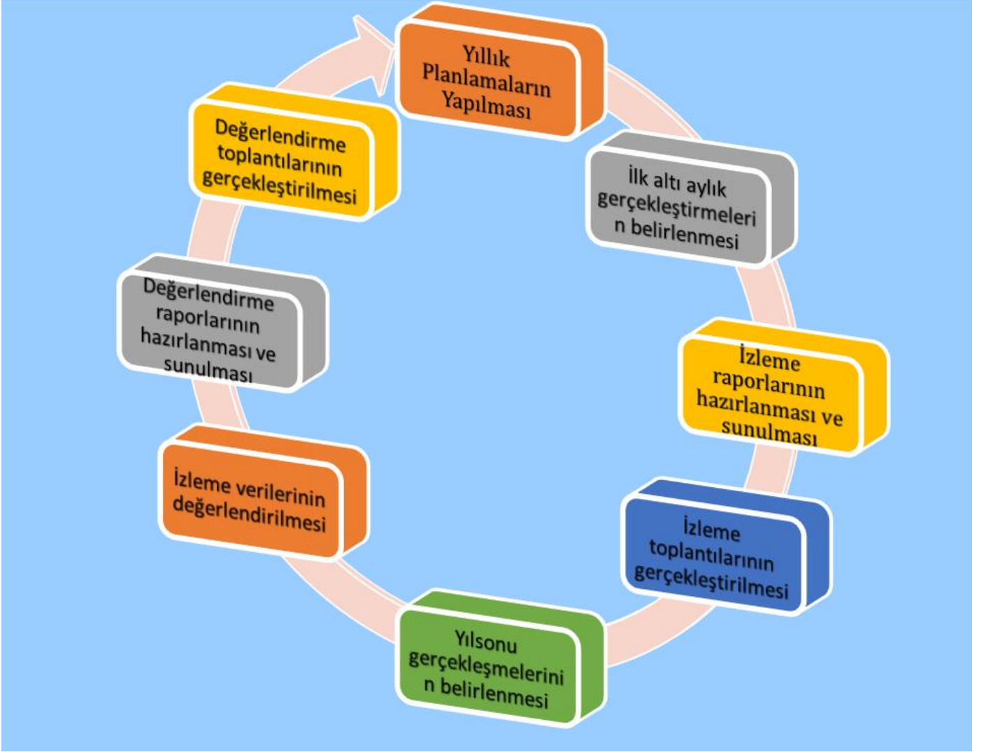
Şekil 2. İzleme ve Süreci